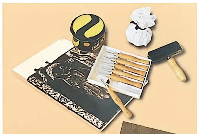
制作木版画的材料和工具