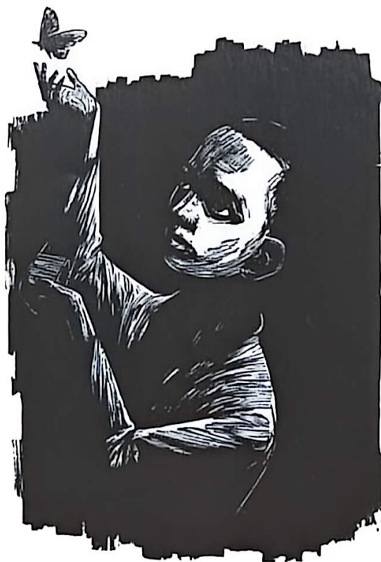
飞吧! 你飞呀! (木刻版画) 宋广训