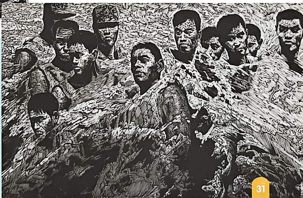
堤 (木刻版画) 现代 武海成