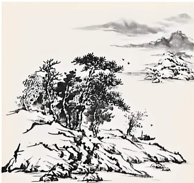
6. 将画好的大块山石与树木、远山组合，绘成一幅山水画小品（注意布局与水的留白）。

我们的祖国江山锦绣、疆域辽阔，北方风景雄奇壮美，南方则葱茏毓秀。你的家乡在哪里，具有怎样的地貌特点？