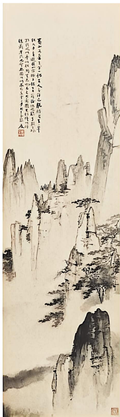
黄山图（中国画） 1933 张大千 北京画院

下图是一张真实的黄山照片，对比上面三幅创作于不同时期、不同风格的山水画，你能从中找到一些相似的元素吗？