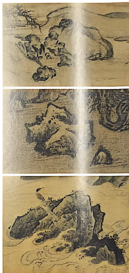
古画中形态各异的石头