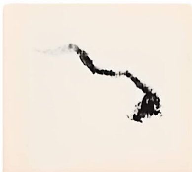
1. 中锋起笔，侧锋折按。