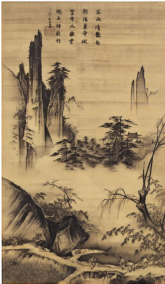
踏歌图（中国画） 宋 马远 故宫博物院

一句“飞流直下三千尺，疑是银河落九天”、一曲《高山流水》、一卷《徐霞客游记》……前人通过各种形式表达着对自然山水的观照与情感。画家又是如何观察和描绘自然之景的呢？