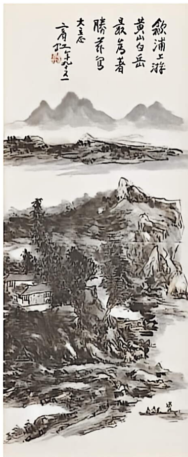
黄山白岳（中国画） 1954 黄宾虹 中国美术馆