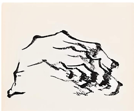
4. 皴法与勾线相结合，形成石头的大致轮廓。