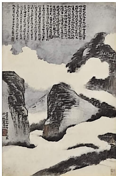
云山图（中国画） 清 石涛 故宫博物院