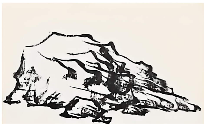
5. 将大小不同、形态各异的石头组合在一起，画出大块山石的形态。