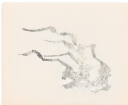
3. 再如此反复几次，注意表现出长短疏密的变化。