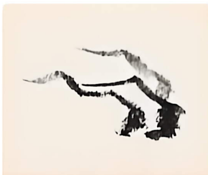
2. 稍加变化，反复三次，画成一个石面。