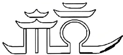
杭州城市标识设计草图