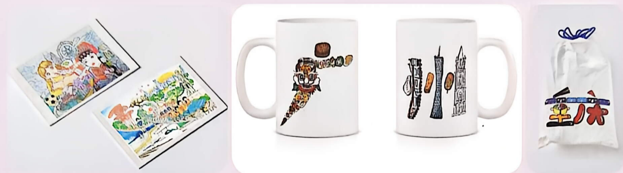
城市标识文创设计作品