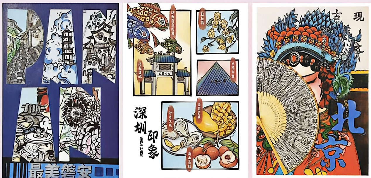
城市海报设计作品