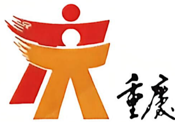
重庆市形象标识“人人重庆”