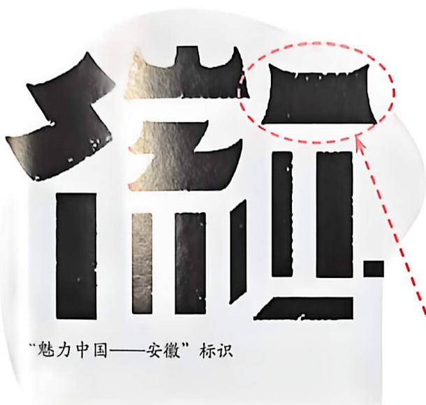
“魅力中国——安徽”标识

徽州文化是中华优秀传统文化的重要组成部分。古朴静谧的徽派建筑和巍峨秀丽的名山大川好似一幅幅水墨画卷。怎样的标识设计能反映地域文化和自然风光？