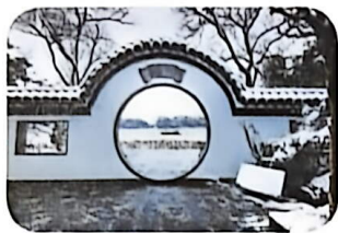
杭州郭庄园林景观